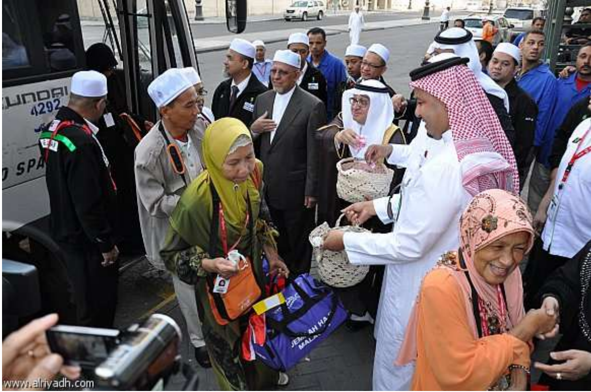
استقبال أولى رحلات الحج